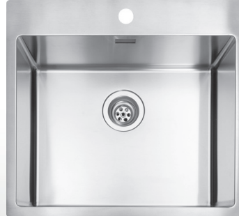
510 x 550 mm

Uusi tyylikäs ja virtaviivainen Divina-allas saatavilla kolmessa koossa. Materiaali: ruostumaton teräs.