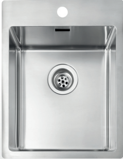
510 x 390 mm