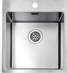
510 x 450 mm