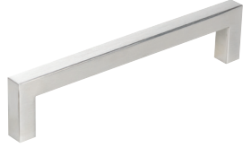
Vedin Tokio cc 96 mm / 128 mm / 160 mm 192 mm / 224 mm / 256 mm 320 mm