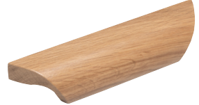
Vedin tammi cc 96 mm