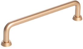
Vedin kulta cc 128 mm

Nämä ja paljon muuta esillä myös Puuseppäpäivillä!