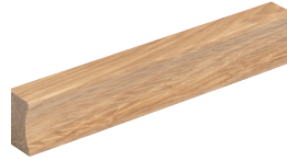
Vedin tammi cc 96 mm